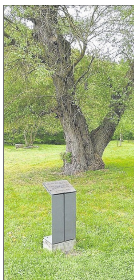
EINE TAFEL erinnert im Kurpark an das „Sicherungslager“.

Anmeldungen werden telefonisch erbeten bei Dieter Dresel, Telefon (0 72 25) 91 96 43.